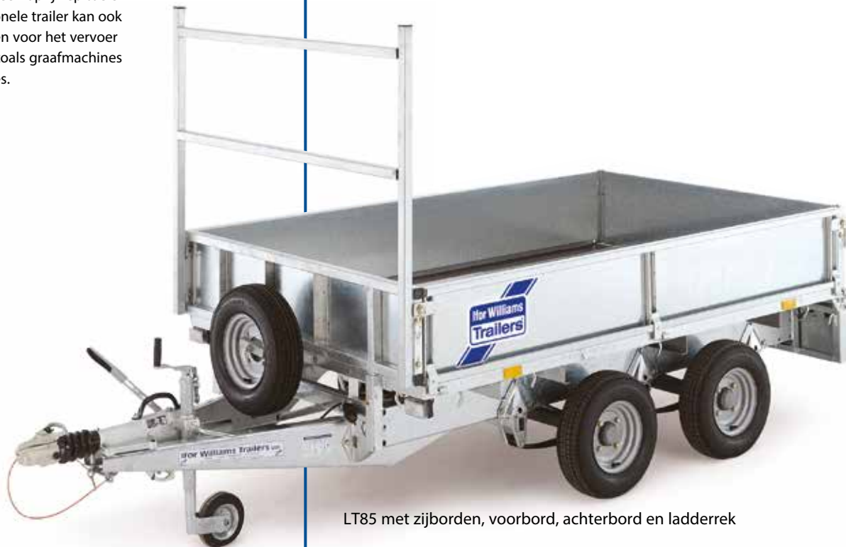
LT85 met zijborden, voorbord, achterbord en ladderrek