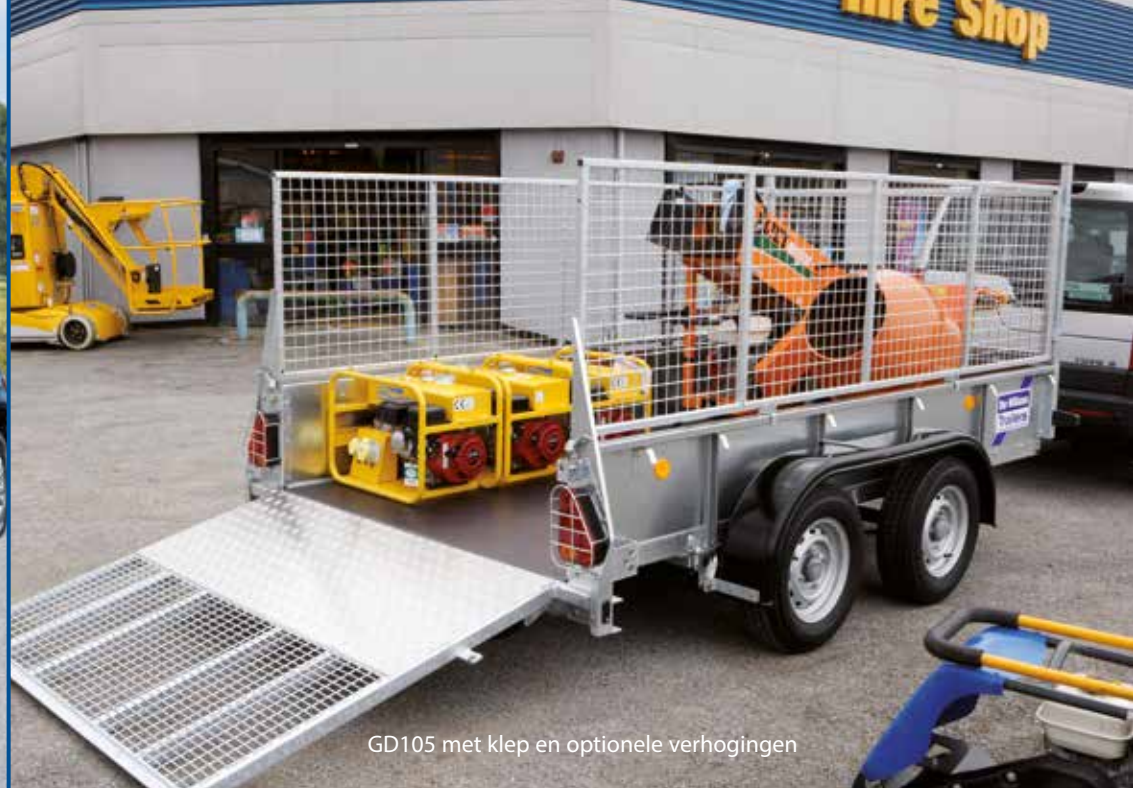
GD105 met klep en optionele verhogingen