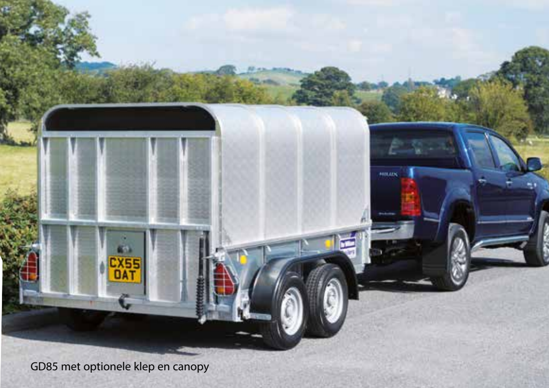
GD85 met optionele klep en canopy