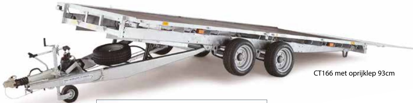
CT166 met oprijklep 93cm