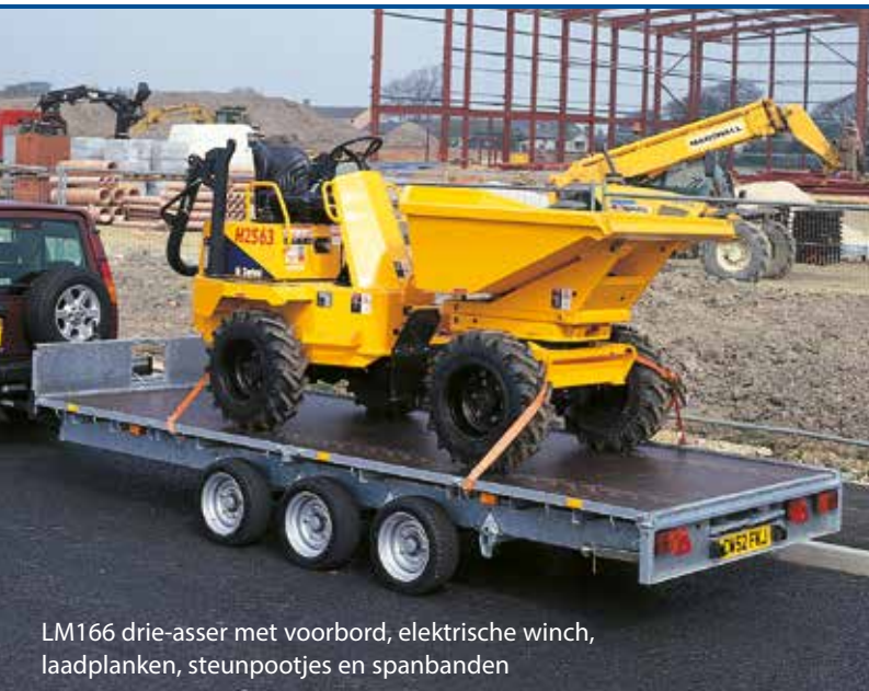
LM166 drie-asser met voorbord, elektrische winch, laadplanken, steunpootjes en spanbanden

Het maximaal toegelaten gewicht varieert van 2000kg tot 3500kg.