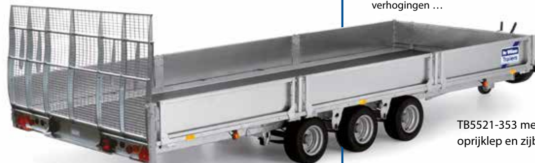
TB5521-353 met oprijklep en zijborden

Voor details hierover zie de specifieke folder van de tiltbeds.