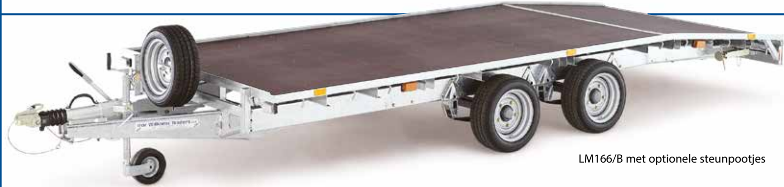
LM166/B met optionele steunpootjes

Voertuigen met verlaagde ophanging zijn niet geschikt om geladen te worden op dit type trailer.