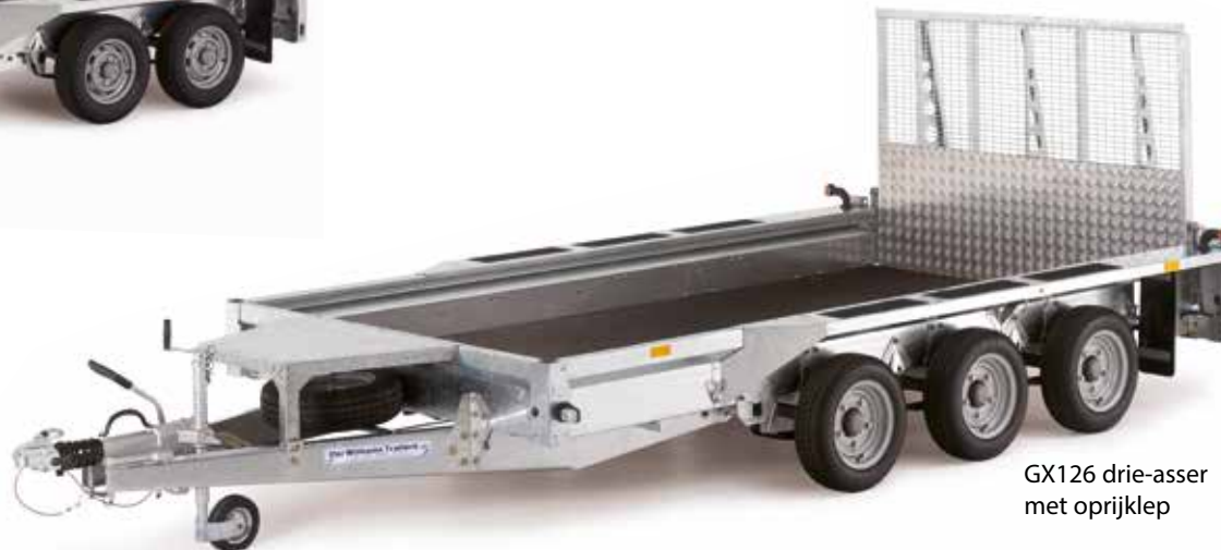
GX126 drie-asser met oprijklep

De GH-serie is de meest recente van de diepladers en is beschikbaar in verschillende afmetingen.