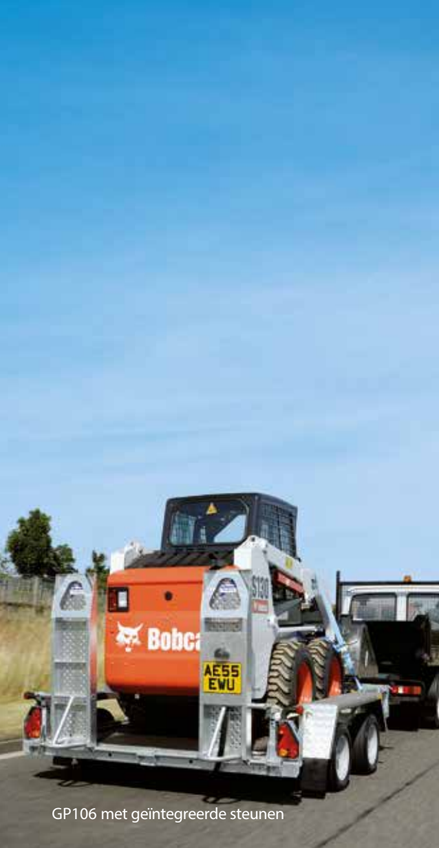
GP106 met geïntegreerde steunen