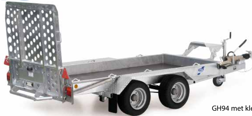
GH94 met klep