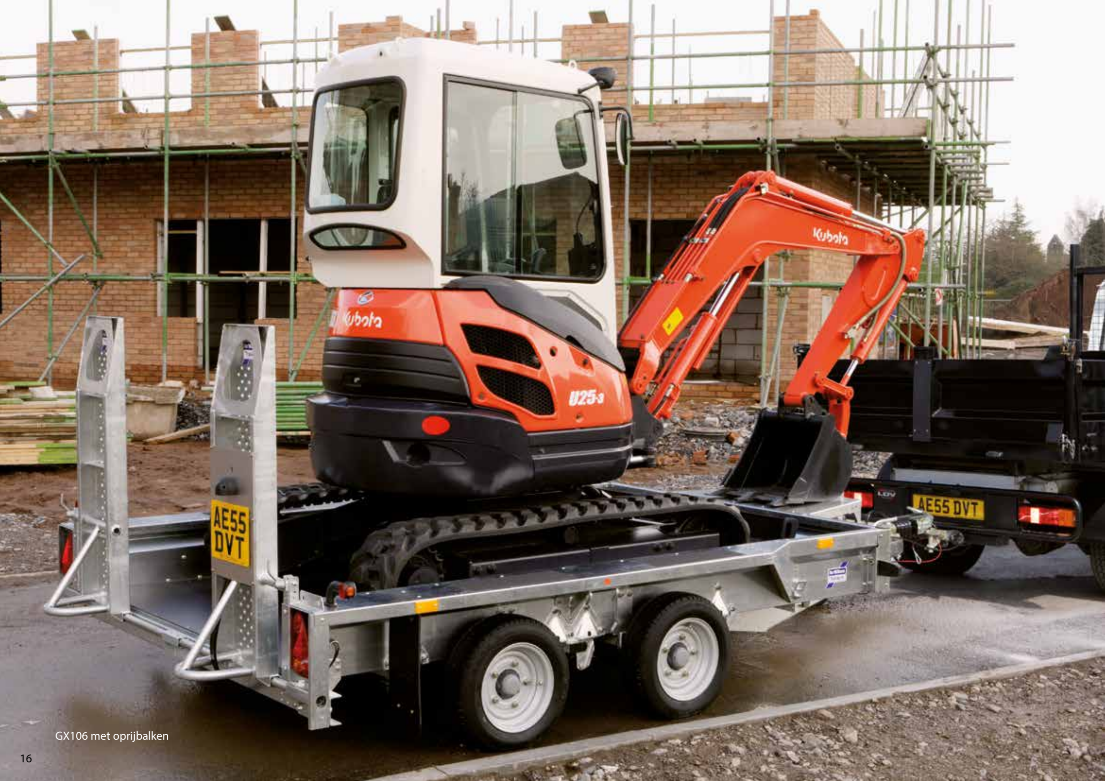
GX106 met oprijbalken