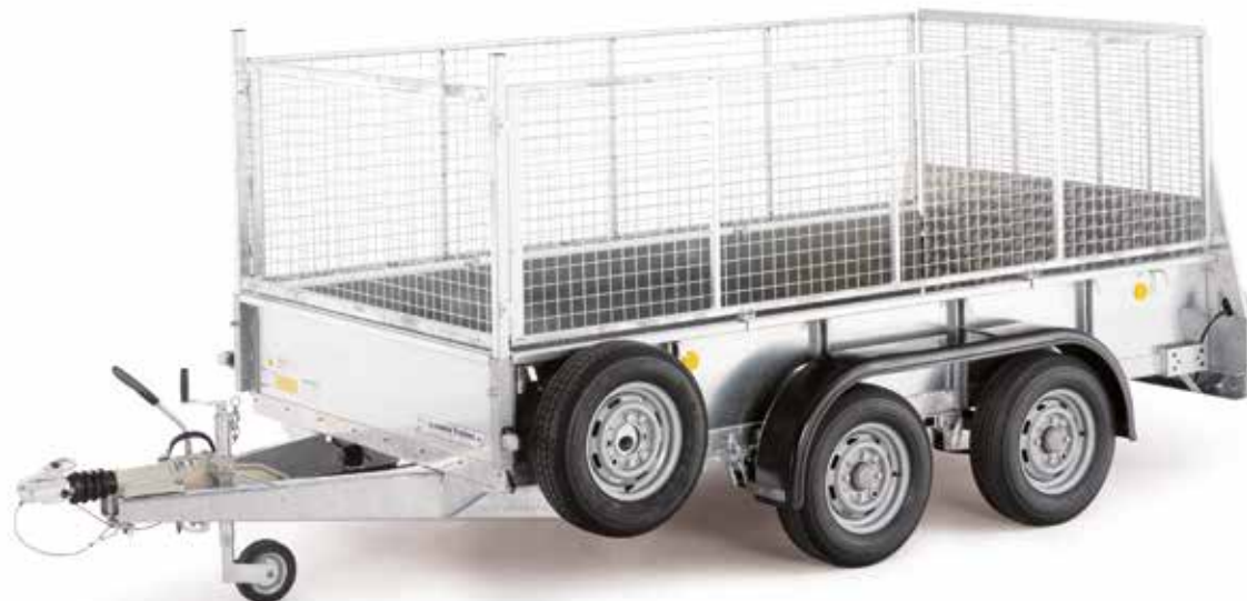
GD105 met oprijklep en de optionele maasstalen verhogingen