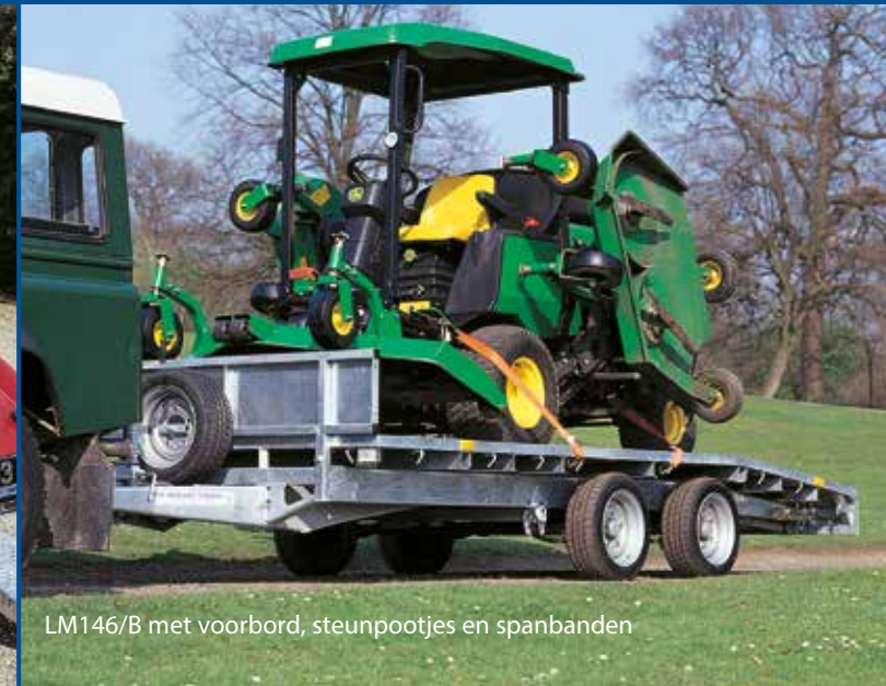
LM146/B met voorbord, steunpootjes en spanbanden