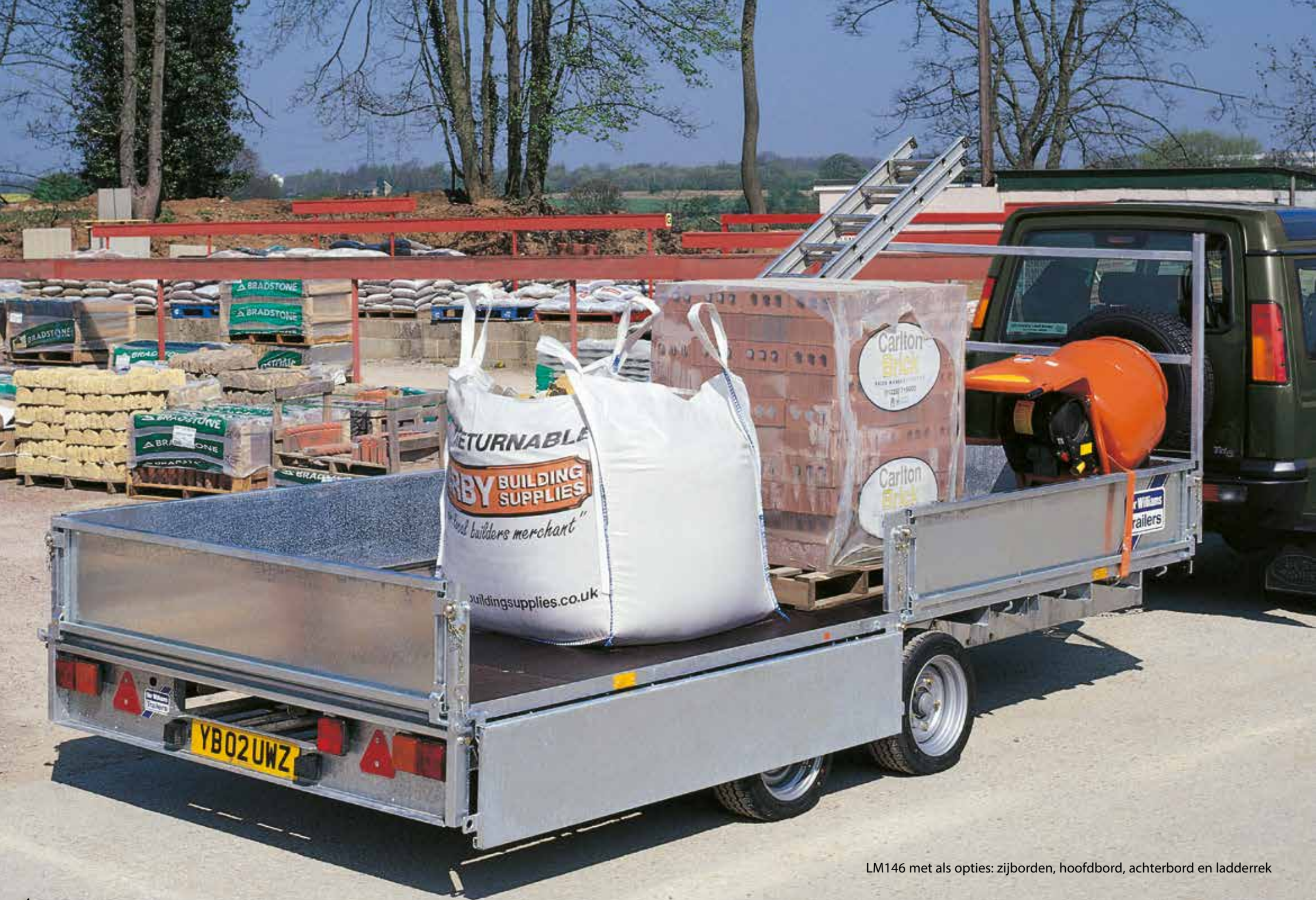
LM146 met als opties: zijborden, hoofdbord, achterbord en ladderrek