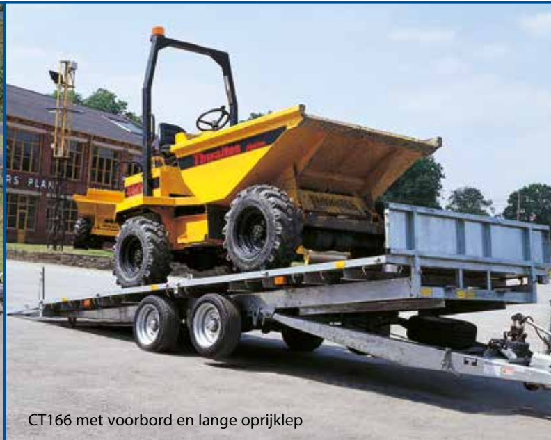
CT166 met voorbord en lange oprijklep