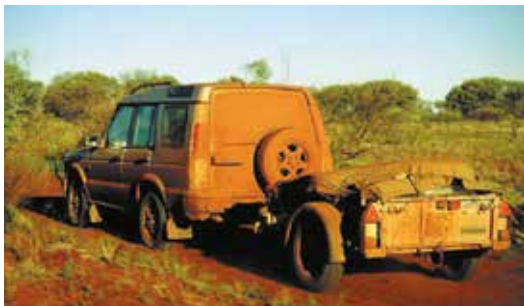
GD64 op missie in de Australische natuur

De algemeen gebruik trailers hebben hun naam niet gestolen: ze worden gebruikt voor elk type lading van bouwmaterialen tot expeditiemateriaal.