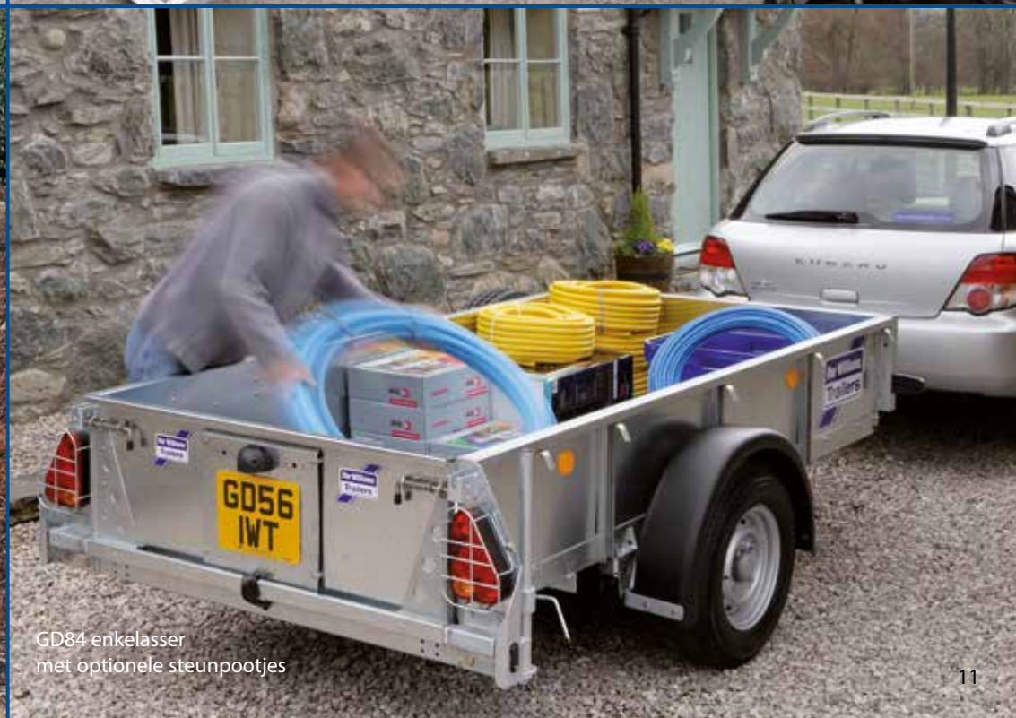
GD84 enkelasser met optionele steunpootjes