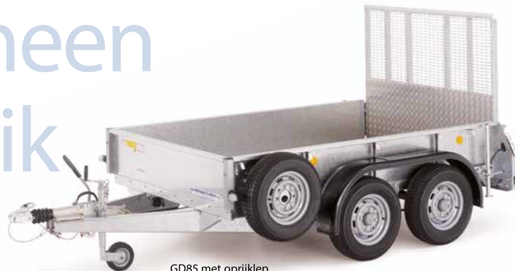
GD85 met oprijklep