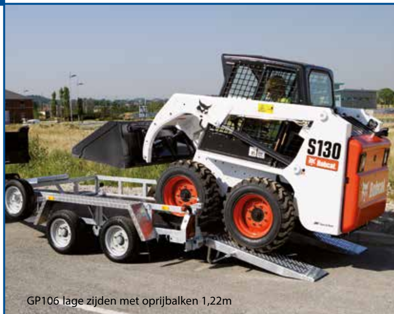
GP106 lage zijden met oprijbalken 1,22m

Deze verhoogde zijkanen bieden het voordeel dat de trailer ook als algemeen gebruik trailer kan gebruikt worden.