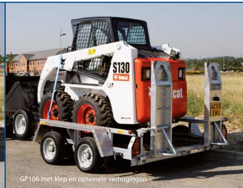
GP106 met klep en optionele verhogingen