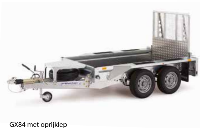
GX84 met oprijklep