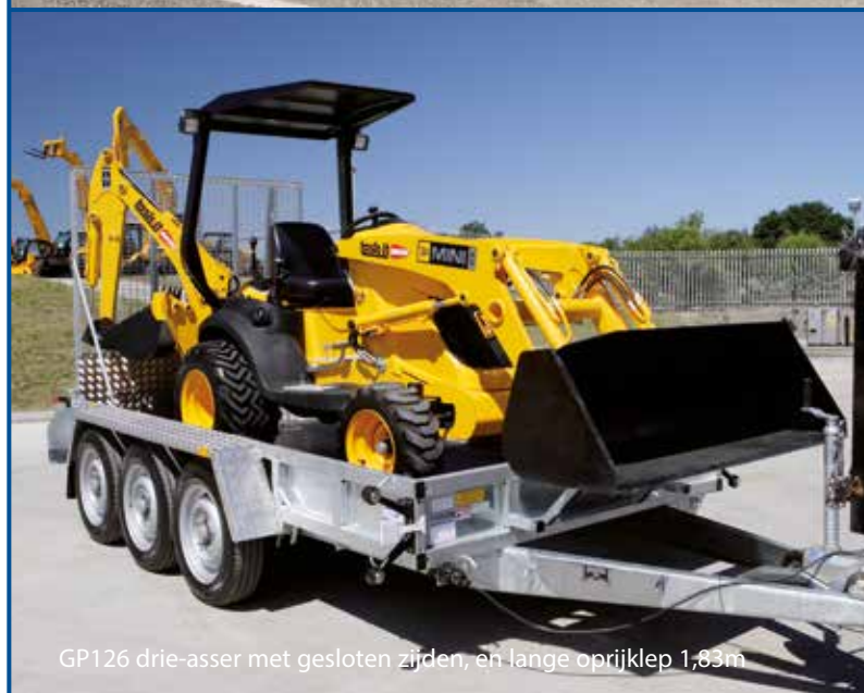
GP126 drie-asser met gesloten zijden, en lange oprijklep 1,83m