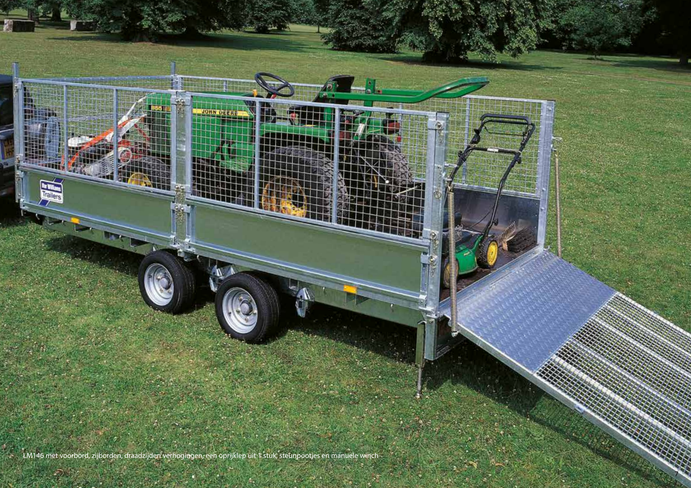
LM146 met voorbord, zijborden, draadzijden verhogingen, een oprijklep uit 1 stuk, steunpootjes en manuele winch