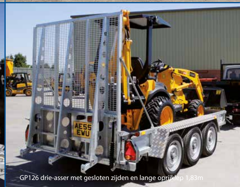
GP126 drie-asser met gesloten zijden en lange oprijklep 1,83m