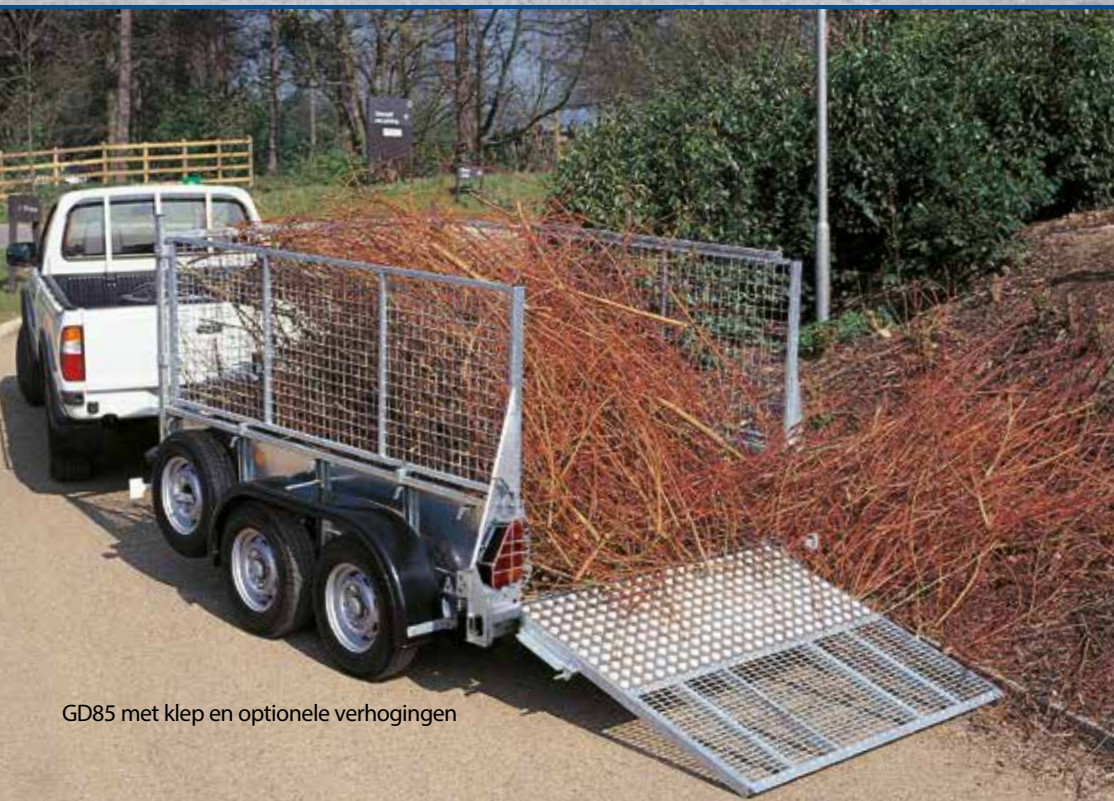
GD85 met klep en optionele verhogingen