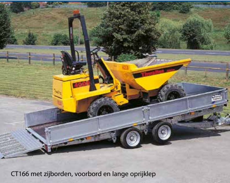
CT166 met zijborden, voorbord en lange oprijklep