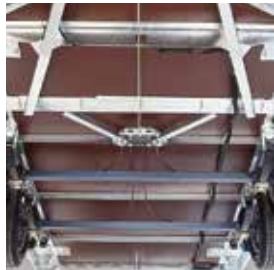
Chassis & Vloer